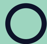
Dor no peito