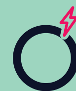
Dor de cabeça