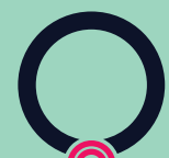
Dor de garganta